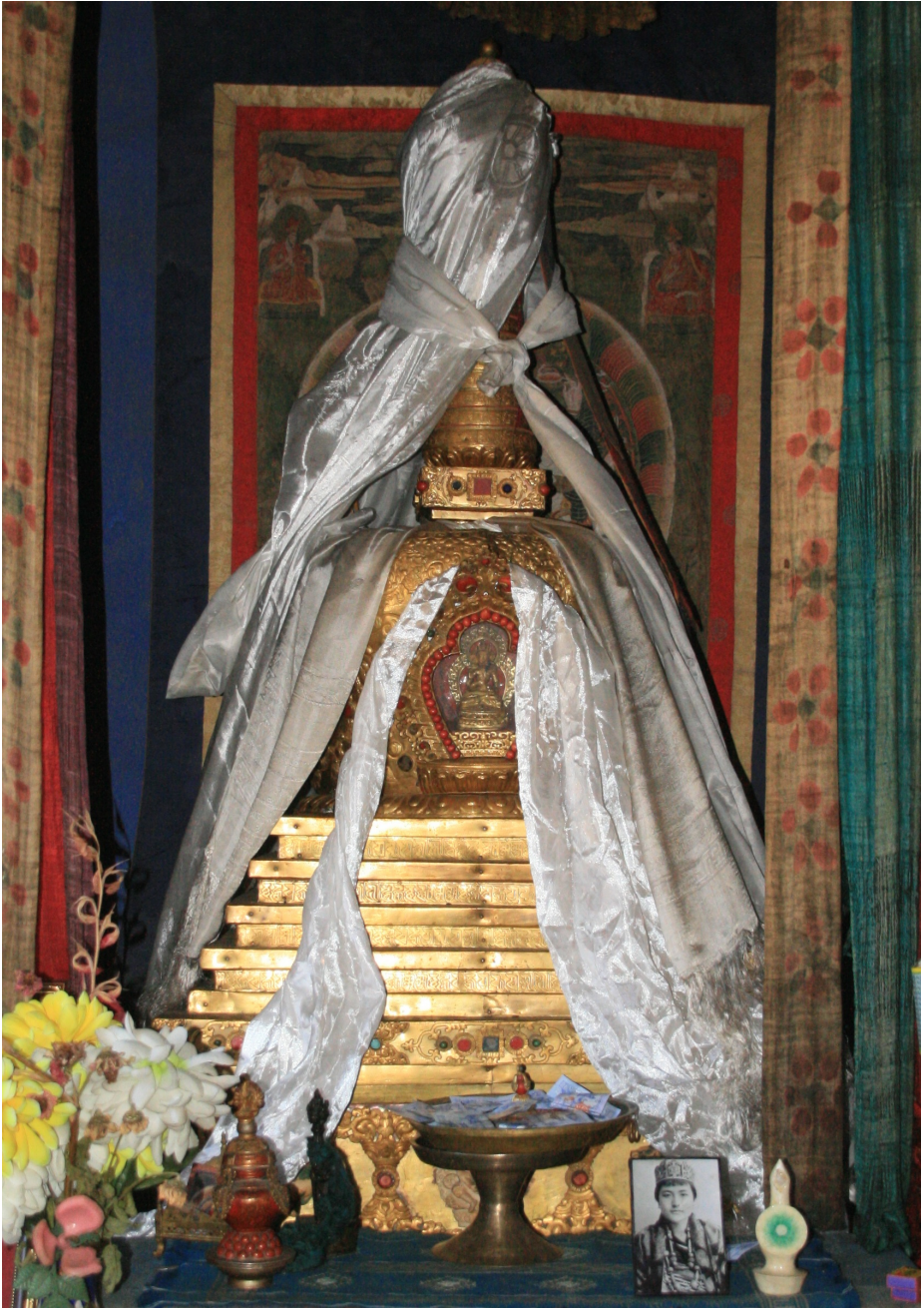
Reliquary containing the remains of Thugse Dawa Gyaltsen in Prakhar