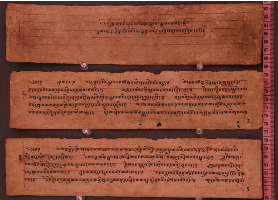
The manuscript of the biography in possession of Dasho Sangay Dorji