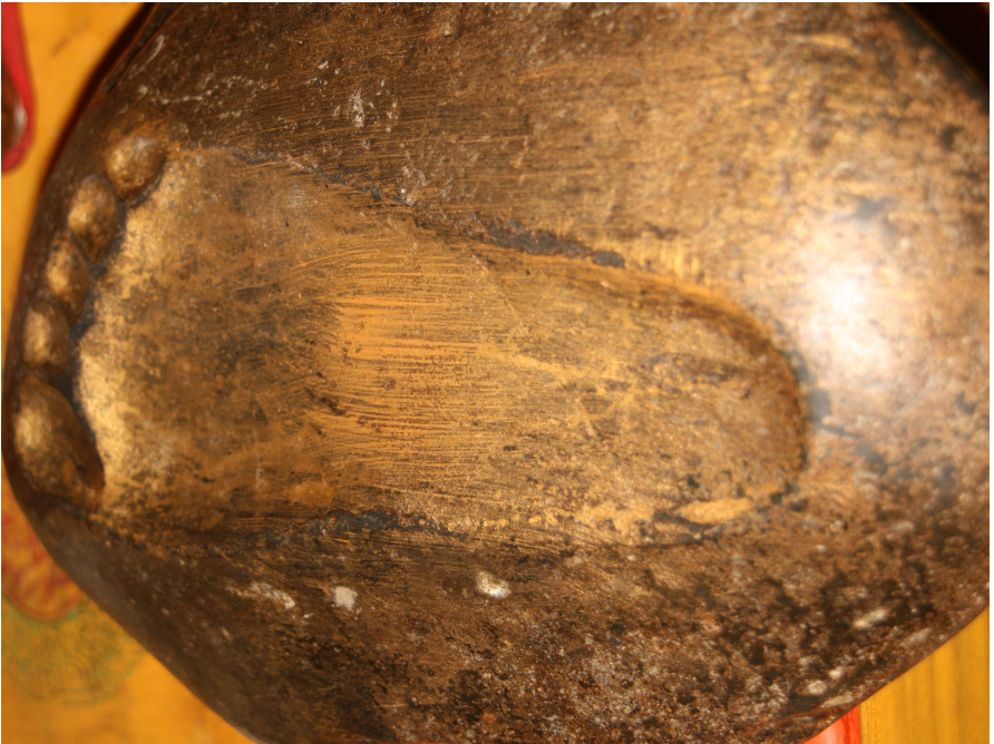
Dawa Gyaltsen's footprint, probably the one he gave to Ngawang Drakpa of Hephu