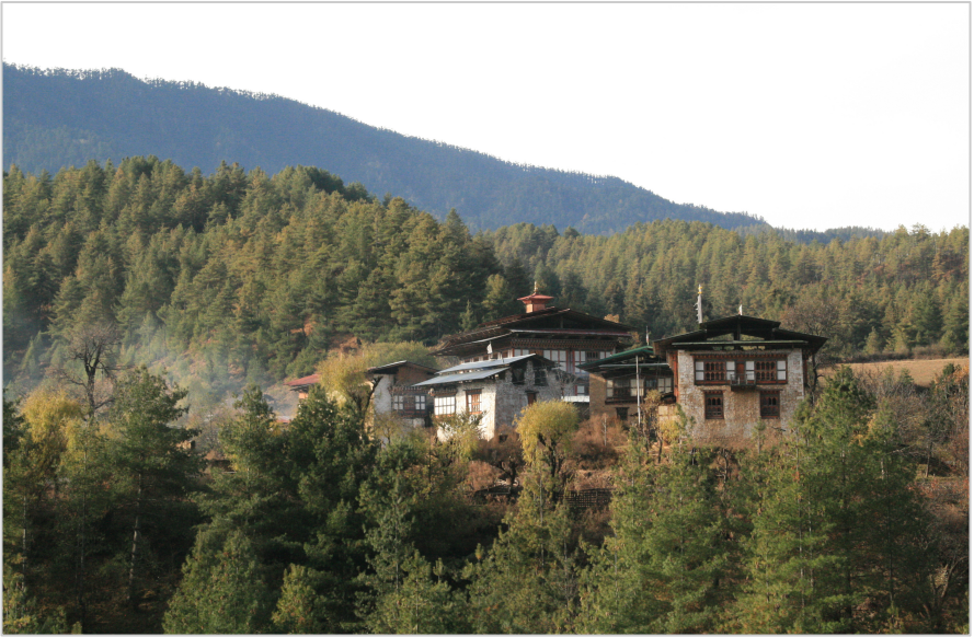
The Prakhar establishment